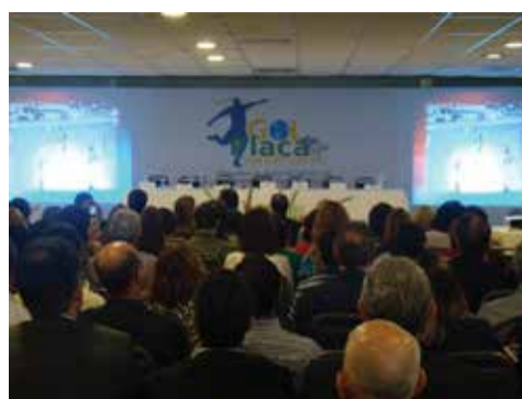
Evento de lançamento