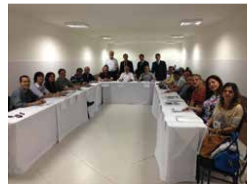
Turma de Desenvolvimento Gerencial

Mais de 150 fazendários já foram beneficiados pelo projeto de desenvolvimento em habilidade gerenciais e pessoais “Gol de Placa Sefaz – Faça Parte desse Time!”. Nesses quatro meses, os alunos das sete turmas (quatro de Relações Interpessoais e três de Desenvolvimento Gerencial) apresentaram um índice de satisfação de 90% com a ação. Estima-se que até o final da iniciativa, em maio de 2015, o projeto terá beneficiado, aproximadamente, 1500 servidores.